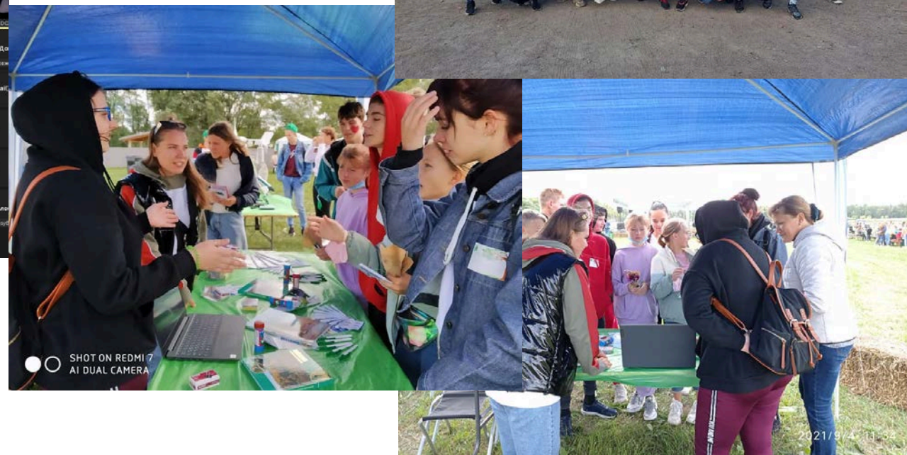
23.09.2021 Презентація студентського архітектурного конкурсу від компанії Steel Freedom