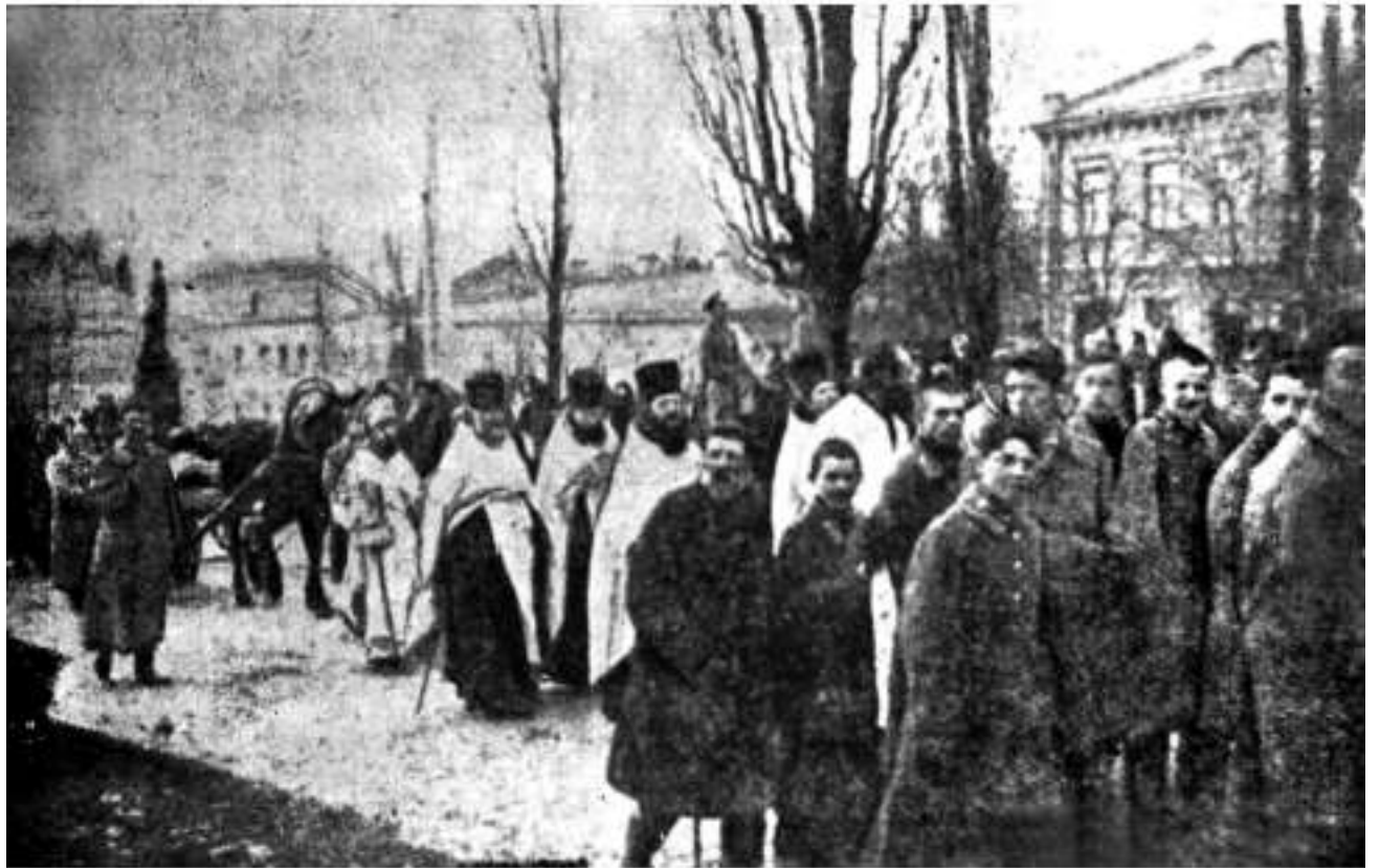
Похорон студентів, які загинули в бою під Крутами. Київ, 10 (23) березня 1918 р.