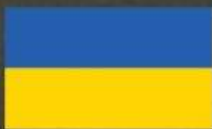
УКРАЇНСЬКА НАРОДНА РЕСПУБЛІКА