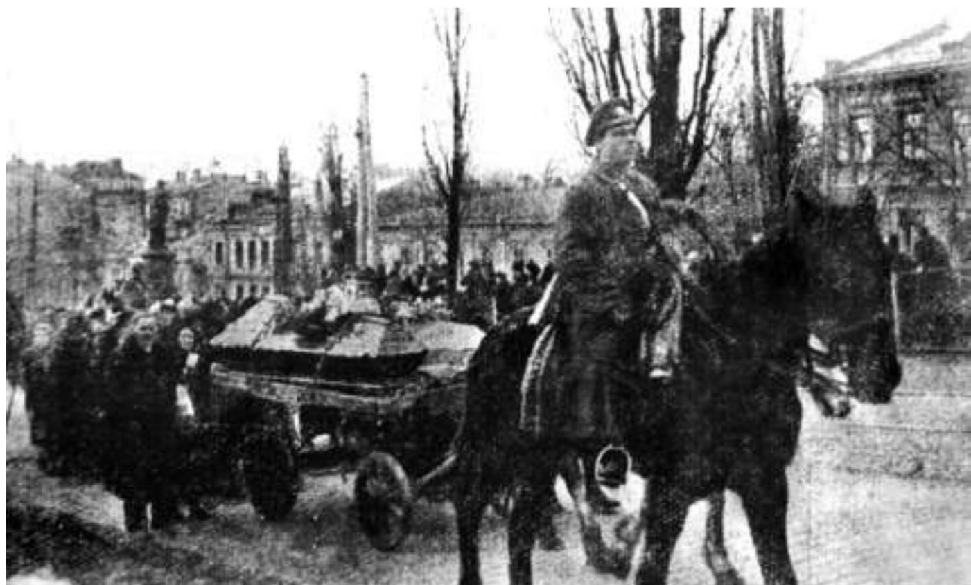
Фрагменти похоронної ходи вулицями Києва. Київ, 10 (23) березня 1918 р.