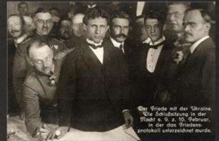
Der Friede mit der Ukraine. Die Schlussitzung in der Stadt a. O. z. 10. Februar, in der das Friedensprotokoll unterzeichnet wurde.