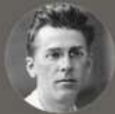
ПАВЛО ТИЧИНА 1918

На Аскольдовій могилі Український цвіт! — По кривавій по дорозі Нам іти у світ.