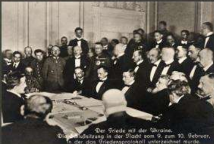
Der Friede mit der Ukraine. Die Schlussitzung in der Stadt vom 9. zum 10. Februar, in der das Friedensprotokoll unterzeichnet wurde.