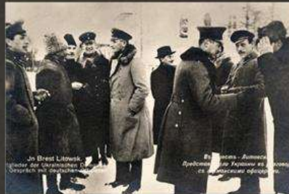
In Brest Litowsk. Die Schlussitzung der ukrainischen Delegation mit den deutschen. In Moskau - Amnestie. Die Schlussitzung der ukrainischen Delegation mit den bolschewistischen. Die Schlussitzung der ukrainischen Delegation mit den bolschewistischen.