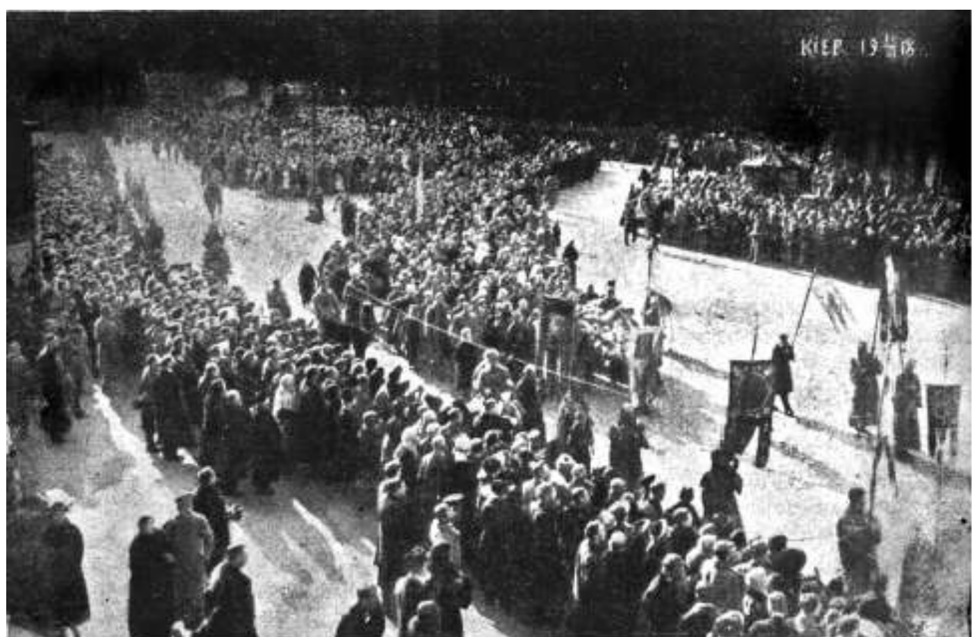
Перепоховання загиблих героїв Крут. Київ, 10 (23) березня 1918 р.