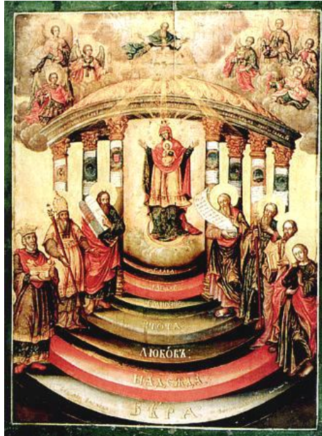
Рис. Ікона Київської Софії Премудрості Божої

ка з собору Успіння Божої Матері в чернігівському Слєцькому монастирі) символізує ідею Боговтілення. Наші барокові співвітчизники глибоко усвідомлювали момент, як Предвічне Слово – Божа Премудрість становиться Плоттю (боговтілення, Слово-Плоть бысть ), а Богородиця відповідно стає Домом Премудрості . У зв'язку з цим розкривається глибинне значення домобудівництва Божого, а саме, його сотеріологічний аспект. Зображені на іконі Софії Премудрості Божої старозавітні праотці і пророки символізують родословну Ісуса Христа та пророцтва щодо втілення Предвічного Слова Божого – Божої Премудрості (рис.).