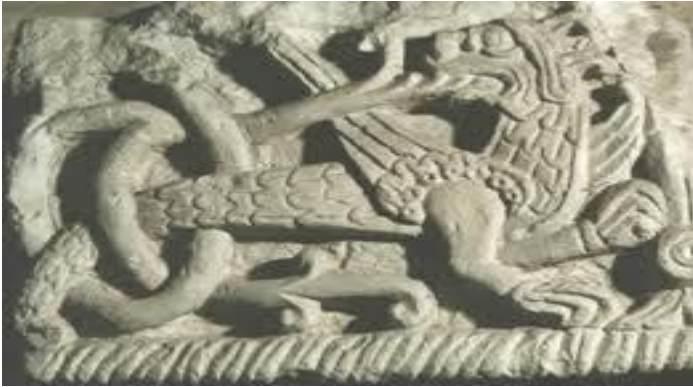
Рис. Капітель Борисоглібського собору в Чернігові

На жаль, декоративна скульптура так і не була встановлена. На думку культурологів, це неофіційний символ, а також оберег нашого міста [2]. Це фантастичний міфологічний звір із головою собаки, парою лап, пташиними крилами, обвитим лозою тулубом, вкритим риб'ячою лускою, котрий закінчується зміїним хвостом. На одному з проєктів, спокійний та сильний, у разі необхідності, Семаргл як дух-охоронець захищає у своїх обіймах Чернігів. Поява цього образу на фронтоні та капітелях Борисоглібського собору йде в кінець XII століття. В соборі і досі зберігається барельєф із зображенням Семаргла того часу. Понад дев'ять століть цей символ захищає Собор, Вал, Княжий град. Небагато міст планети можуть похвалитися пам'ятниками міфологічної скульптури, подібної Семарглу. Він символізує Всесвіт, що складається з трьох рівнів: небес у вигляді птаха, землі у вигляді звіра, підземного світу у вигляді змії. Образи всіх трьох рівнів зливаються в одну істоту, яка втілює в собі космос, як живий організм, як єдність стихій, де царює Семаргл.